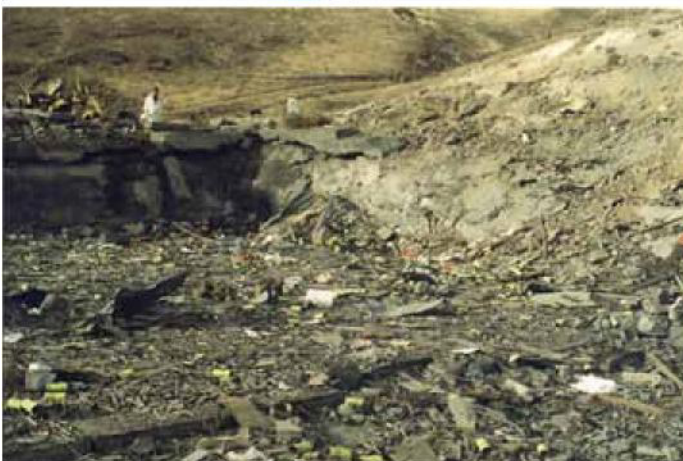
Abbildungen 2 und 3: Booster-Raum 2 vor und nach der Explosion (CSB)