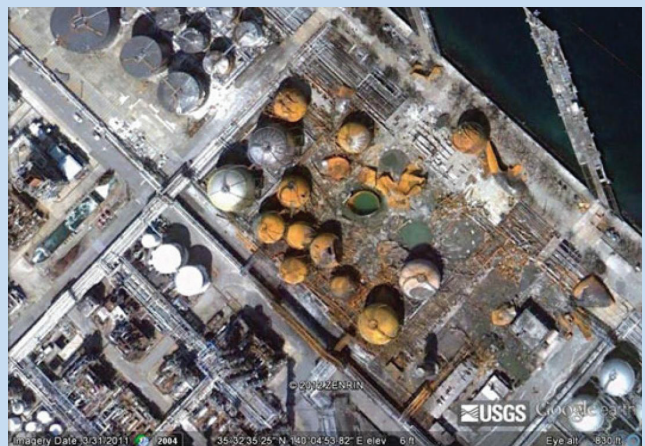
الشكل 4: خزان غاز البترول المسال في مصنع تكرير تشيبا بعد أن تسبب الزلزال في اندلاع الحرائق والانفجارات (2012 جوجل، ZENRIN)