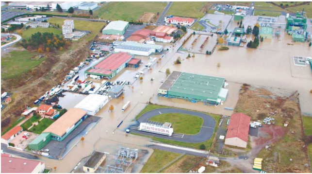
الشكل 2: الموقع المتأثر

بعد موجة من الأمطار الغزيرة (حوالي 300 ملم من 31 أكتوبر إلى 2 نوفمبر منها 3 ساعات من هطول الأمطار شديدة الغزارة)، تسبب التصريف غير الكافي للمياه من مبيت منطقة تجميع المياه بالمنطقة الصناعية في حدوث فيضان. وصل مستوى المياه في الموقع بالكامل من 20 سم إلى 1 متر. ونظرًا لمضي عملية التصنيع قدمًا، فقد ضرب فريق العمل جرس التنبيه حتى قبل مراقبة ارتفاع منسوب المياه في المنشأة. نفذ المشغل خطة الطوارئ الداخلية يوم الأحد 2 نوفمبر في الساعة 04:00 ص تقريبًا وكون قسمًا لإدارة الأزمات يضم 6 وحدات (التدخل، والاتصالات، والهندسة، والمعلومات، والتشغيل والخدمات اللوجستية). استخدم المشغل موارد كبيرة لرفع المعدات والمواد أو إخلائها، والحفاظ على أهم المواد الكيميائية (من حيث السلامة والقيمة المالية) بعيدًا عن الماء، ووقف عمليات التصنيع جنبًا إلى جنب مع الطي الآمن للمعدات (مراحل التوقف الآمن المحددة في حالات السلامة للتفاعلات الكيميائية باستثناء المفاعلات الساخنة والتي يجب تبريدها أولاً قبل الإغلاق) ووضع خطط قطع التيار الكهربائي قبل إغراق الفيضان للمعدات الحساسة. غمرت مياه الفيضان مصنع المواد الكيميائية بالكامل حيث تراوح مستوى المياه من 0.2 إلى 1 متر. وكانت الخسائر داخل المصنع محدودة نسبيًا بسبب الإجراء الفوري الذي اتخذه المشغل. نتج عن الفيضان إتلاف المياه لبعض المعدات بشكل كبير أو حدوث تلفيات كبيرة في منشآت محددة.