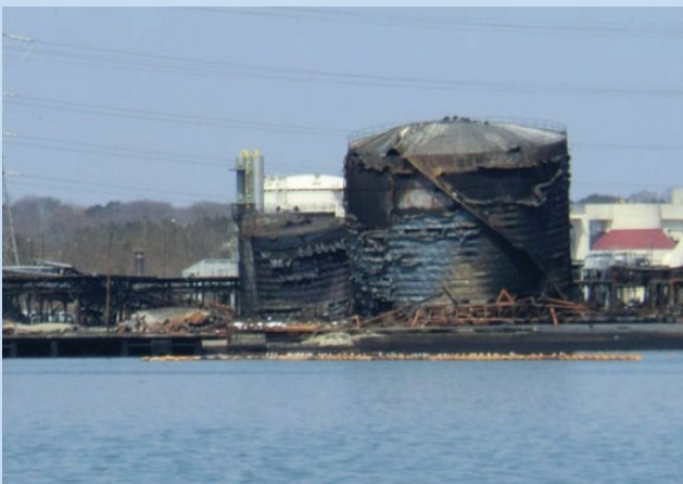
الشكل 5: الصهاريج المحترقة في مصنع تكرير سينداي الذي ضربه إعصار تسونامي

[حادث النظام الإلكتروني للحوادث الطبيعية التكنولوجية رقم 21]