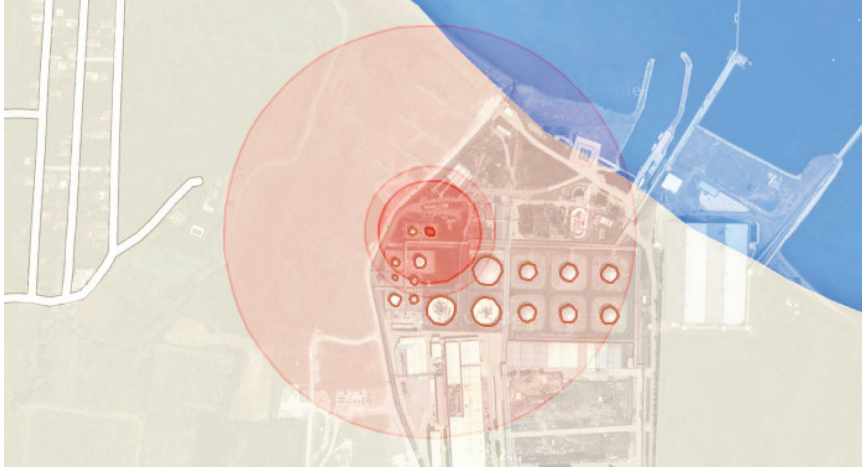
الشكل 6: مخرج RAPID-N لإطلاق المواد القابلة للاشتعال من خزان نتيجة الزلزال.

هناك نظام جديد على شبكة الإنترنت، وضعه مركز البحوث المشتركة، يقيم ويخطط للتأثير المحتمل للأخطار الطبيعية على المنشآت الكيميائية. يسمى النظام RAPID-N، وهو يوفر إطار عمل لتقدير خطر تسريبات المواد الخطرة في أعقاب الكوارث الطبيعية (وهو ما يسمى بخطر طبيعي تكنولوجي). وهو يحدد المناطق المعرضة لمخاطر طبيعية تكنولوجية ويقيم المخاطر المرتبطة بها، لدعم تخطيط استخدام الأراضي والتخطيط للاستجابة في حالات الطوارئ، وتقدير الأضرار والإنذار المبكر.